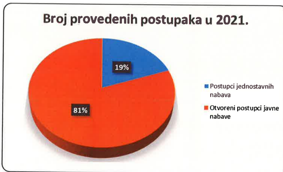
Slika 26: Struktura provedenih postupaka javne nabave u 2021. godini

Odjel za pravne poslove, ljudske resurse i javnu nabavu pružao je i isključivo savjetodavne usluge u vidu pregleda pripremljene dokumentacije o nabavi od strane korisnika, pružanje pomoći kod konkretnih problema u provedbi postupaka javne nabave (tamo gdje su korisnici samostalno provodili nabave), kao i pomoći u fazi realizacije već ranije sklopljenih ugovora o javnim nabavama.