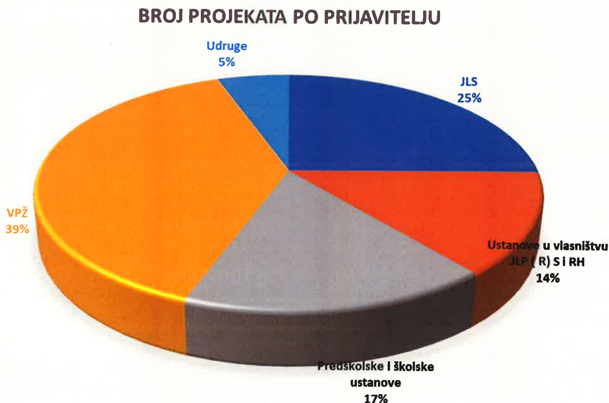
Slika 2: Broj projekata prema prijavitelju u 2021. godini

Popis svih projekata kao i njihova kratka analiza nalazi se u nastavku.